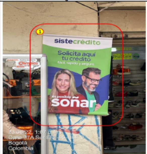
Elemento de PEV del establecimiento comercial, adicional al aviso único permitido, ubicado en la fachada de la edificación