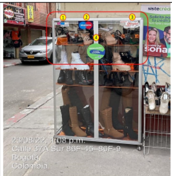
Elemento no regulado, ubicado en área que constituye espacio público, en el cual se evidencia elementos de PEV del establecimiento de comercio.