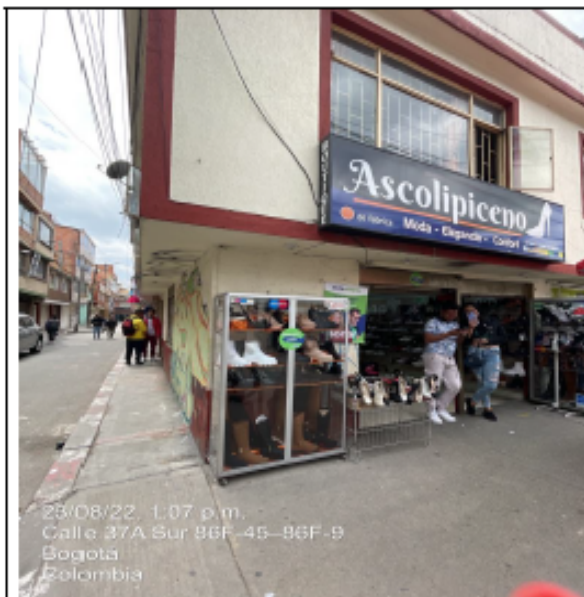
Panorámica donde se encuentra ubicado el establecimiento ASCOLIPICENO, en la dirección Calle 37 A sur No. 86 F – 10.